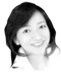
参議院議員 牧山ひろえ