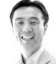
参議院議員 水戸まさし