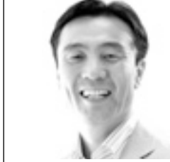
参議院議員 水戸まさし