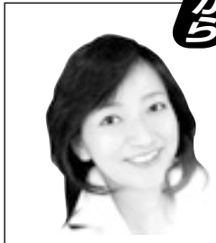
参議院議員 牧山ひろえ